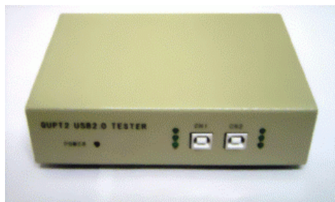
QUPT2 USB2.0 快速测试仪

QUPT(Quick USB Port Tester) USB2.0 快速测试仪是新一代主板、USB HUB 生产线配套测试设备,能够在很短的时间内完成 HS/FS/LS 及其 Control transfer, Bulk transfer, ISO transfer, INT transfer 各种项目测试任务, QUPT2 还支持 Vbus, D+ D-测试。该产品可测试各种型号的电脑主机板(已可支持 ICH7 笔记本电脑), PCI 卡, HUB 及 KVM。